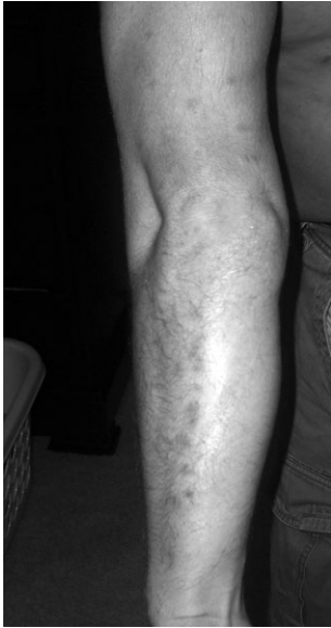
Figura 2. Las picaduras del insecto de cama en un brazo, 5 días después.

mosquitos) y pueden desarrollar ronchas que pican, inclusive, algunas veces ampollas (Figura 2). El rascado excesivo puede desembocar en una infección secundaria. Las reacciones a las picaduras de dichos insectos generalmente desaparecen por sí solas y requieren muy poco tratamiento, no más que unas cremas antisépticas o antibióticas, o cremas para prevenir la infección.